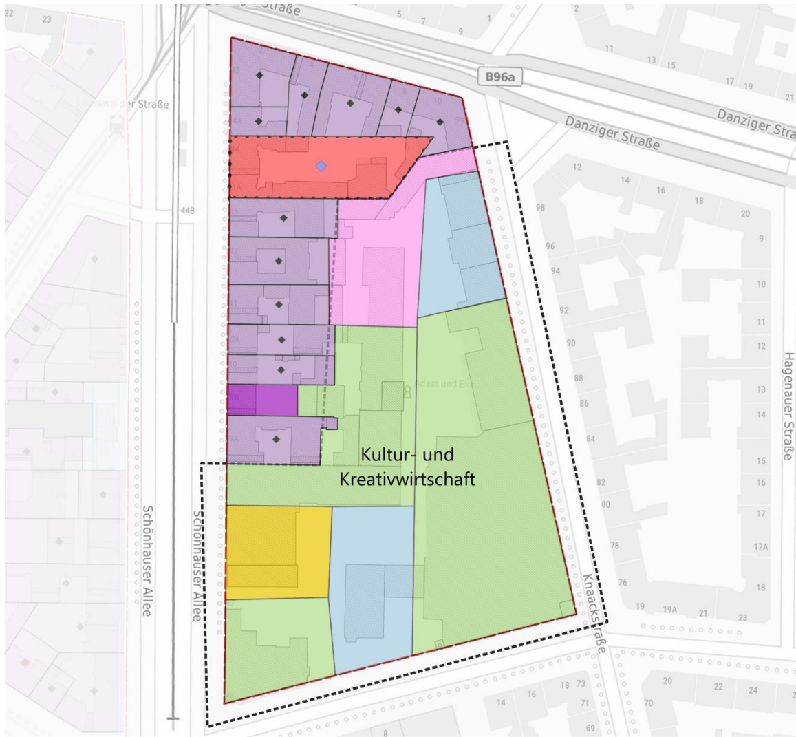
Gebiet 29: Kulturbrauerei, OT Prenzlauer Berg